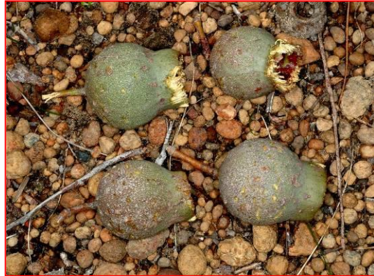
바우딘코카투가 먹은 Marri 열매